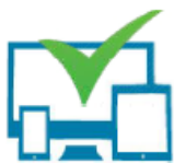
Briefing par Email